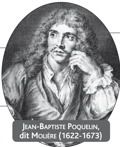
JEAN-BAPTISTE POQUELIN, dit MOLIÈRE (1622-1673)

Molière écrit en 1666 Le Médecin malgré lui qui reprend l'histoire du Médecin volant composé vers 1650. Comme souvent, Molière s'y moque des médecins prétentieux.